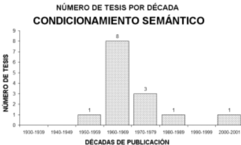
Figura 7. Evolución de tesis realizadas sobre el Condicionamiento Semántico.