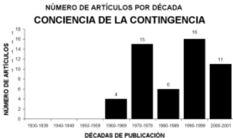
Figura 4. Evolución del número de artículos publicados sobre la Conciencia de la Contingencia

Un estudio comparativo del número de artículos publicados en cada década nos da una idea de la desigual evolución de estos tres conceptos, pudiéndose observar que el Condicionamiento Semántico está más extendido temporalmente mientras que el Condicionamiento Evaluativo es el más actual y también el más prolífico en la década de los 90 (véase figura 5).