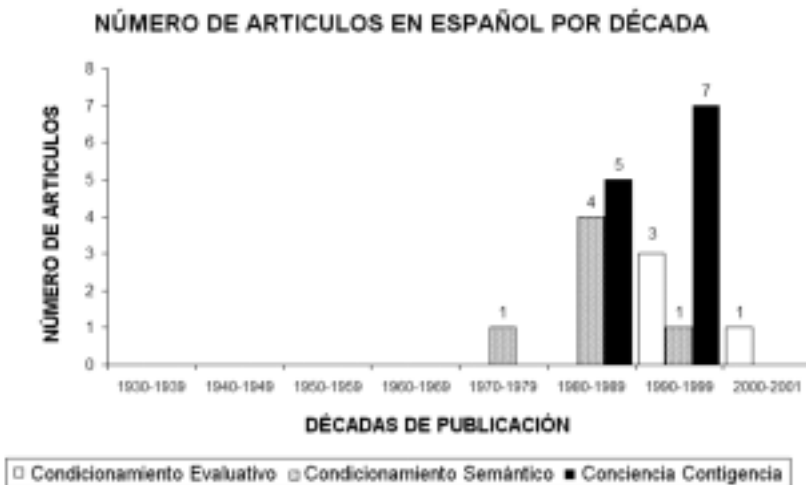
Figura 13. Evolución comparativa del número de artículos en español realizados sobre el Condicionamiento Evaluativo, Condicionamiento Semántico y Conciencia de la Contingencia.

Respecto a la adquisición , algunos autores consideran que es una condición necesaria para que se produzca el condicionamiento (Dawson y Shell, 1985; Huertas,