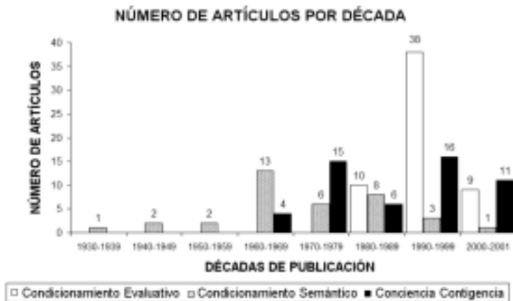
Figura 5. Evolución comparativa del número de artículos publicados sobre el Condicionamiento Evaluativo, Condicionamiento Semántico y Conciencia de la Contingencia.