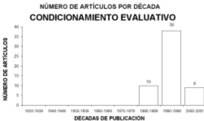
Figura 2. Evolución del número de artículos publicados sobre el Condicionamiento Evaluativo

Condicionamiento Semántico: (término de búsqueda en habla inglesa Semantic Conditioning ). Comienza su estudio en la década de los 30 (con 1 artículo) y evoluciona lentamente hasta la década de los 60 en que tiene su máxima expresión (13 artículos). Progresivamente va perdiendo importancia, aun manteniendo niveles elevados, a pesar de lo cual se considera un tema importante de estudio; en estos dos años de la presente década únicamente se han publicado 2 artículos (véase figura 3).