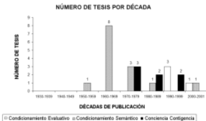
Figura 9. Evolución comparativa del número de tesis realizadas sobre el Condicionamiento Evaluativo, Condicionamiento Semántico y Conciencia de la Contingencia.