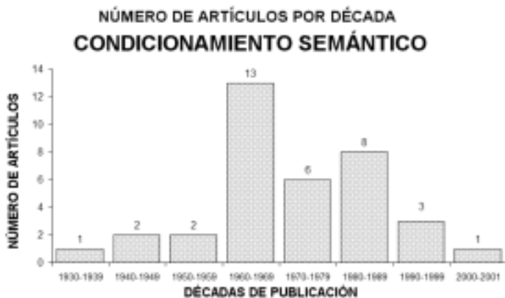
Figura 3. Evolución del número de artículos publicados sobre el Condicionamiento Semántico

Conciencia de la Contingencia : (término de búsqueda en habla inglesa Contingency Awareness ). Los primeros trabajos aparecen en la década de los 60 (con 4 artículos), alcanzando su máxima expresión en las décadas de los 70 y de los 90 con 15 y 16 artículos respectivamente. Es tanta la actualidad de la investigación en ésta área que en los dos últimos años se ha obtenido una producción muy elevada de trabajos (11