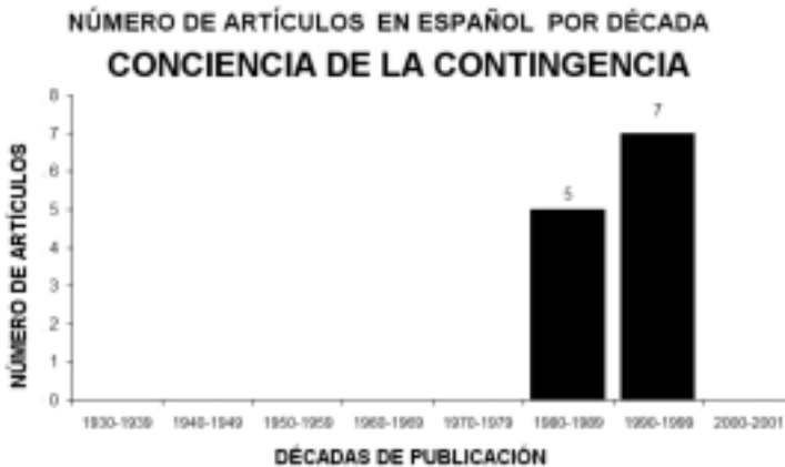
Figura 12. Evolución del número de artículos publicados en español sobre la Conciencia de la Contingencia.

Un estudio comparativo del número de artículos en español nos da una idea de la desigual evolución de estos tres conceptos, pudiéndose observar que el Condicionamiento Semántico está más extendido temporalmente, aunque esta vez el estudio de la Conciencia de la contingencia ha obtenido la máxima producción (en los 90), (figura 13).