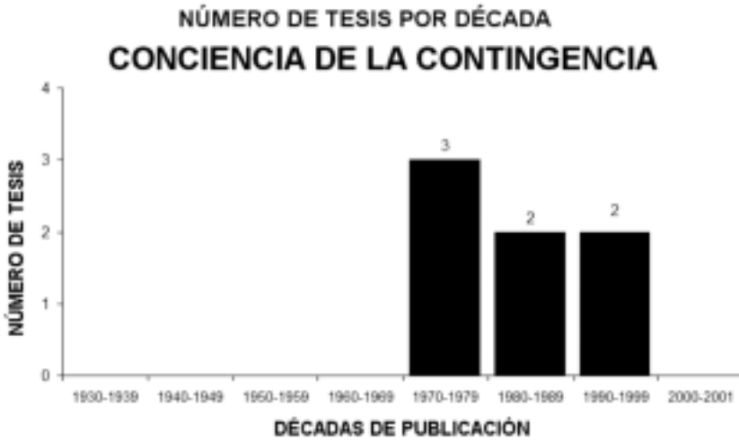
Figura 8. Evolución de tesis realizadas sobre la Conciencia de la Contingencia.

Un estudio comparativo del número de tesis realizadas por décadas nos da una idea de la desigual evolución de estos tres conceptos, pudiéndose observar que el Condicionamiento Semántico está más extendido temporalmente y además es el más actual y también el más prolífero, en la década de los 60 (figura 9).