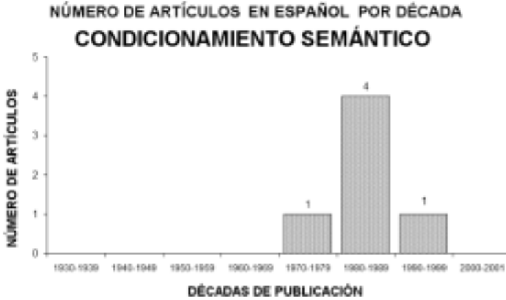
Figura 11. Evolución del número de artículos publicados en español sobre el Condicionamiento Semántico.