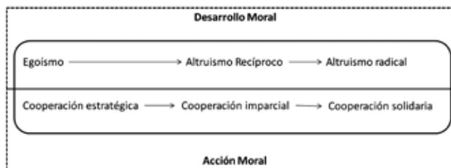
Figura 1. Evolución del desarrollo moral y de la acción moral en las relaciones entre individuos

Esta línea de evolución (véase figura 1), cuando se coordina con las consecuencias de la acción moral del individuo sobre otros individuos o un grupo particular (Villegas, 1995), sugieren el paso de una cooperación estratégica orientada por el beneficio propio, pasando por la cooperación imparcial en la cual se restringe la consideración de diferencias superficiales entre individuos y finalizando en una cooperación solidaria, capaz de admitir principios éticos y de bienestar común.